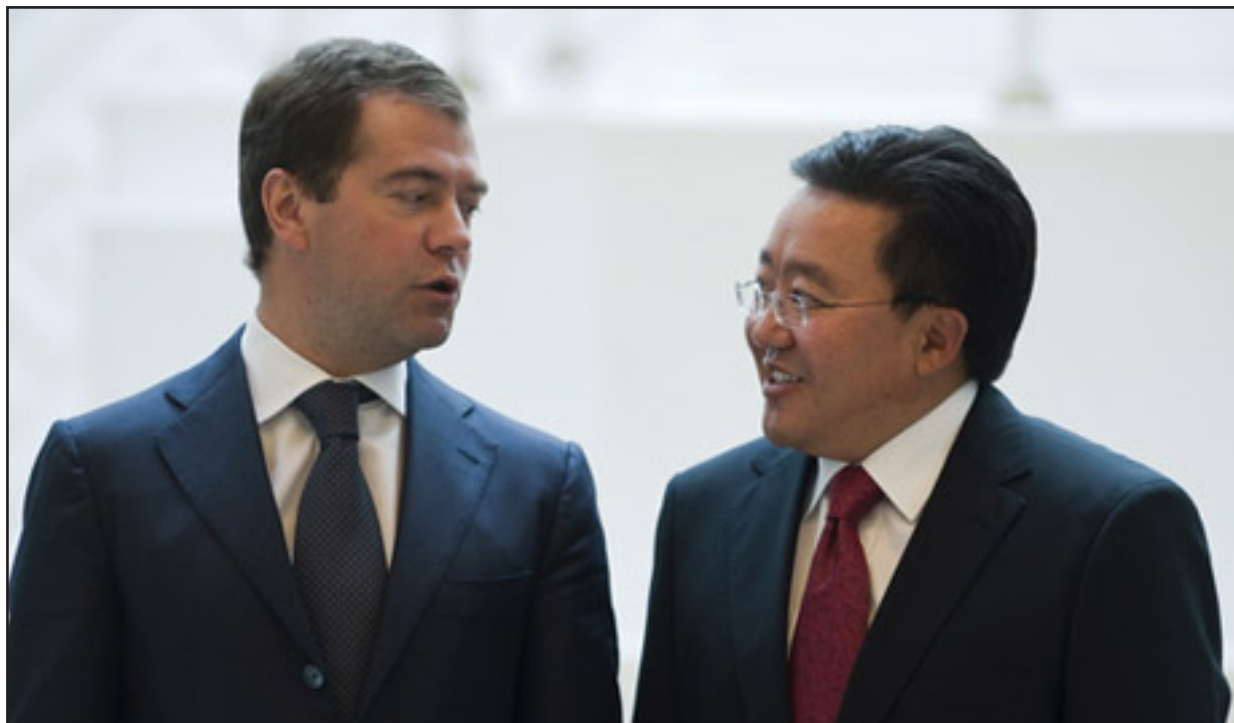
(Давоми. Боши 1-саҳифада)

Инқилоб ҳуқуқларнинг берилиш даражаси билан ўлчанишини тушуниб етмоқ керак. Агар ҳокимиятга келганлар, давлат ва халқ ҳисобидан яшаб, кам сонли одамларнинг манфаатини кўзласа, кўпчилик изтироб чекса, камбағаллашса, инқилоб ва демократия ҳақида гапиришнинг маъноси қолмайди. Бундан кўра ўзгаришлар ҳақидаги чақириқларга кулоқ осган маъқул.